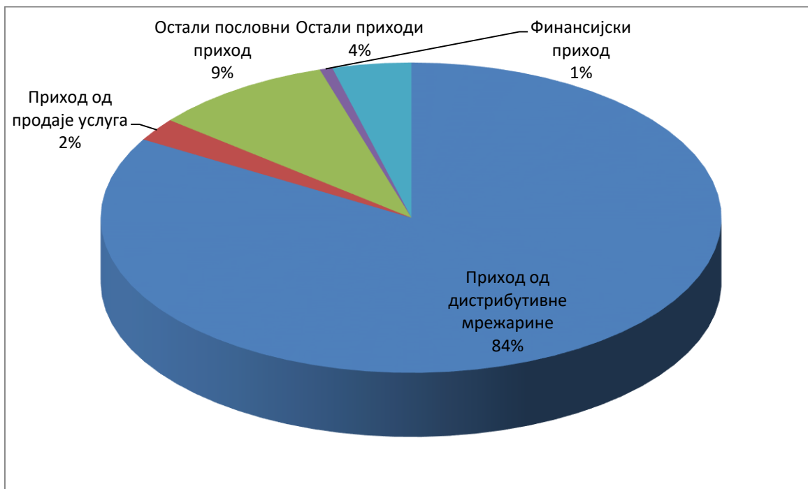
Графикон 2 – Структура укупних прихода